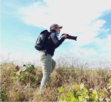
어린이숲생태교육 ‘초록동무’ 자원활동교사(2020~)