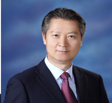
어린이숲생태교육 ‘초록동무’ 자원활동교사(2020~)