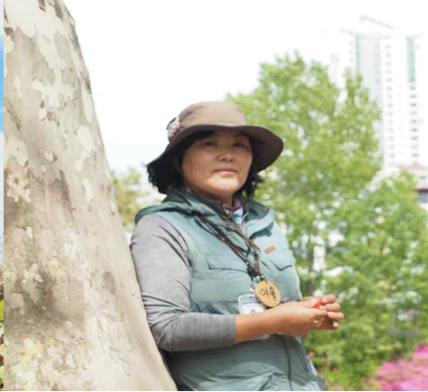
어린이숲생태교육 ‘초록동무’ 자원활동교사(2020~)