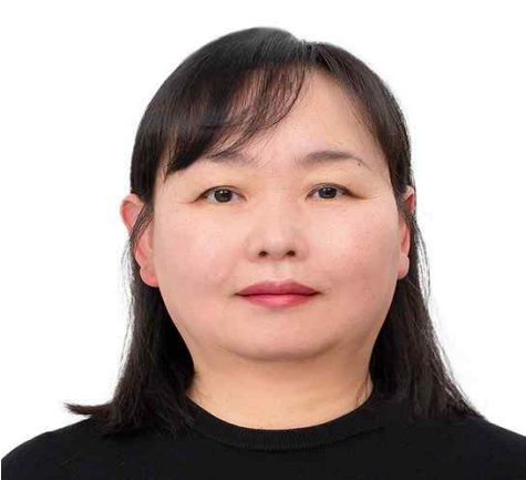
어린이숲생태교육 ‘초록동무’ 자원활동교사(2020~)