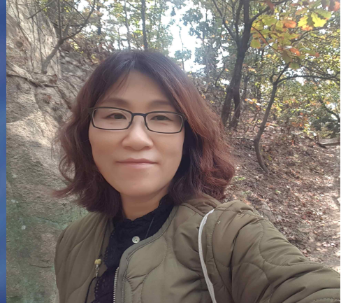
어린이숲생태교육 ‘초록동무’ 자원활동교사(2020~)

* 만 3년 이상 꾸준히 자원활동으로 함께한 회원, 그리고 특별히 감사인사를 전하고픈 회원께 드립니다.