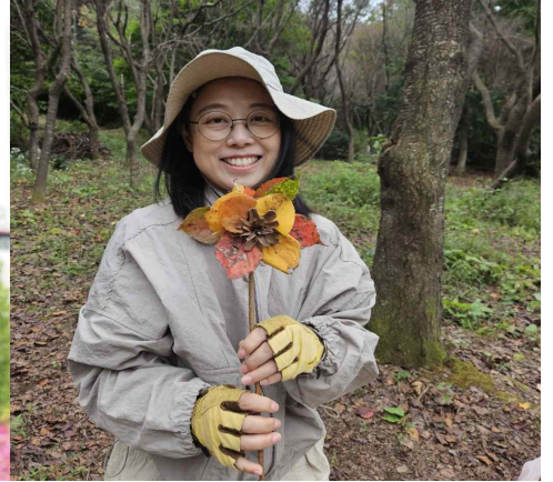
어린이숲생태교육 ‘초록동무’ 자원활동교사(2020~)